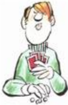
Dos ases Sacar la lengua