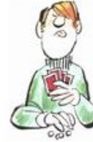
Tres Ases Sacar la lengua a un lado