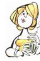
Medias Torcer la boca a un lado