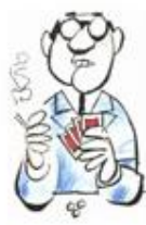
Dos Reyes Morderse el labio inferior