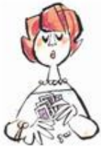
Ciego Cerrar los ojos