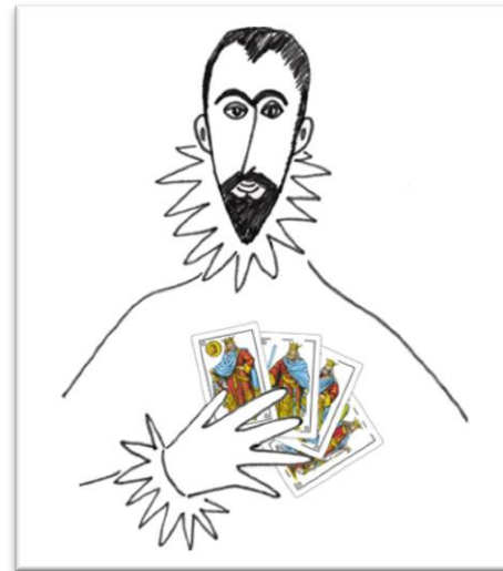
Campeonato de Mus